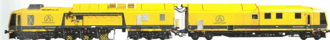
SF06-FFS Plus Höchste Leistungsanforderung in Langzeiteinsätzen