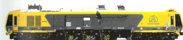
SF03-FFS Universell einsetzbar, gerüstet für jegliche Herausforderung