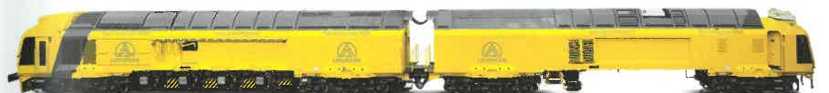
MG31 Der schnellste Schienenfräszug der Welt